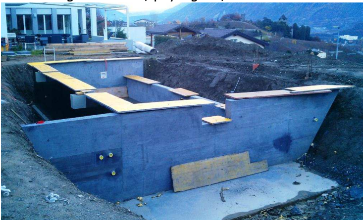
Anlage im Bau, eingefärbt mit je 2% FP 3300 + Weiss