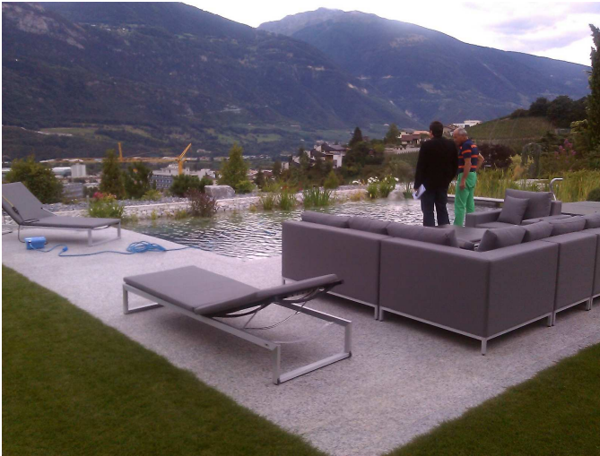
Fertige Anlage Naturbad

Ausführung: Alain Duc, paysagiste, Crans-sur-Sierre