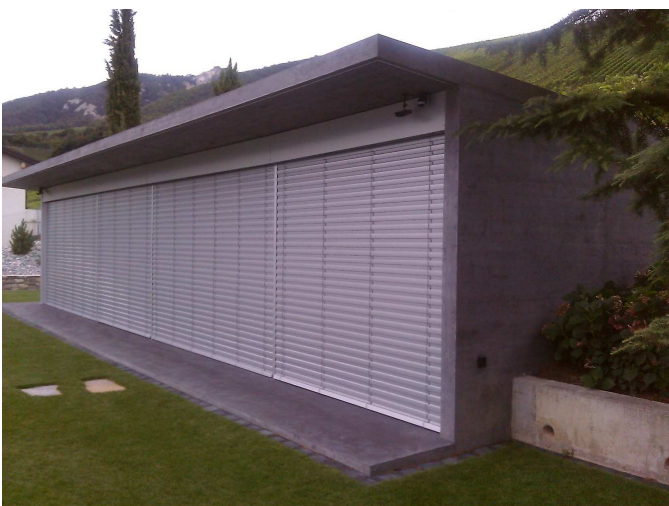
Wellnessbereich mit hydrophobiertem Betondach Porenreduzierte Oberfläche mit CemAktiv 806 TEOS Ultra Dichtungsmittel + RXF54 Fiber Hybridfaser