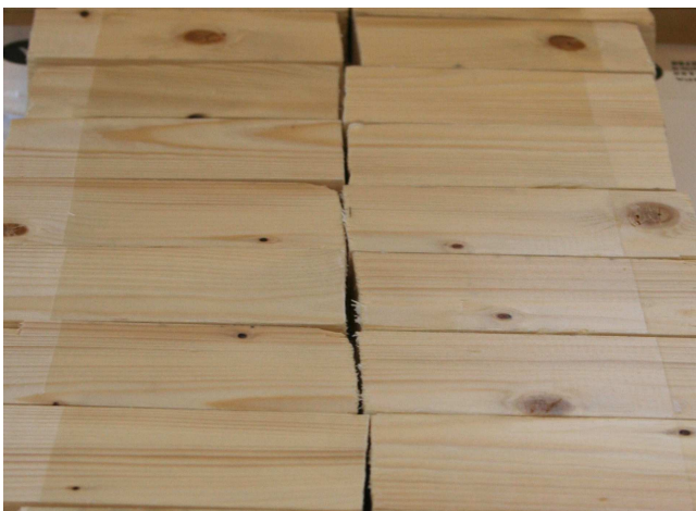
Wood Protect schimmert nur matt und konserviert die natürliche Holzstruktur und Farbe