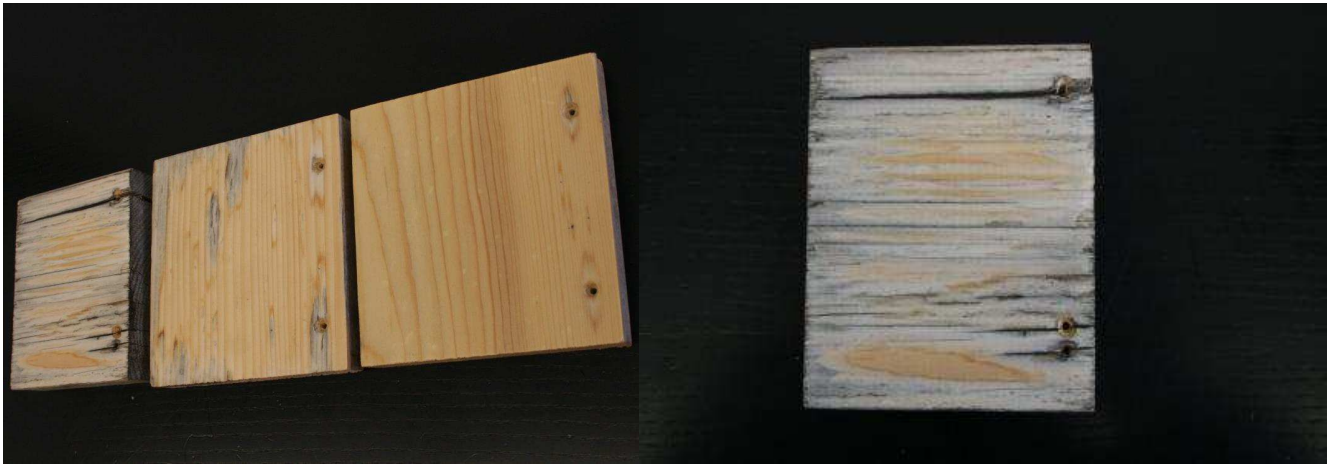
Überblick Holzschutzversuch Spanien 2011-2013 Nur 1-K Holzschutzlack