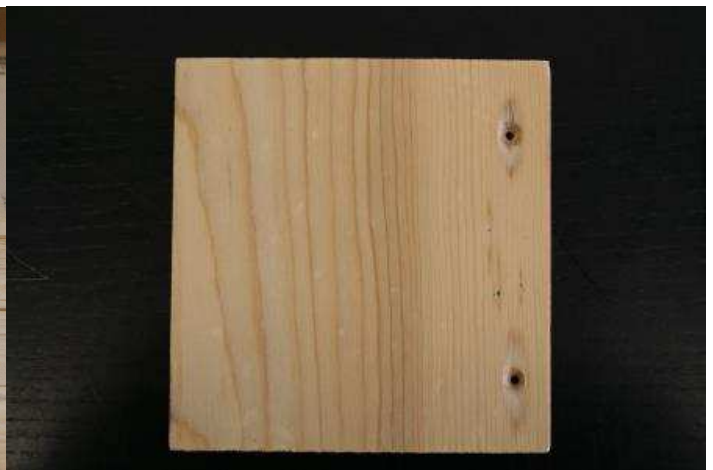
Grundierung mit Ligno Fix gegen das Grau werden und Wood Protect Schutz