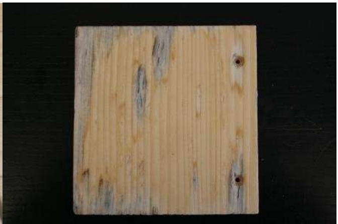
Nur Wood Protect mit UV Schutz